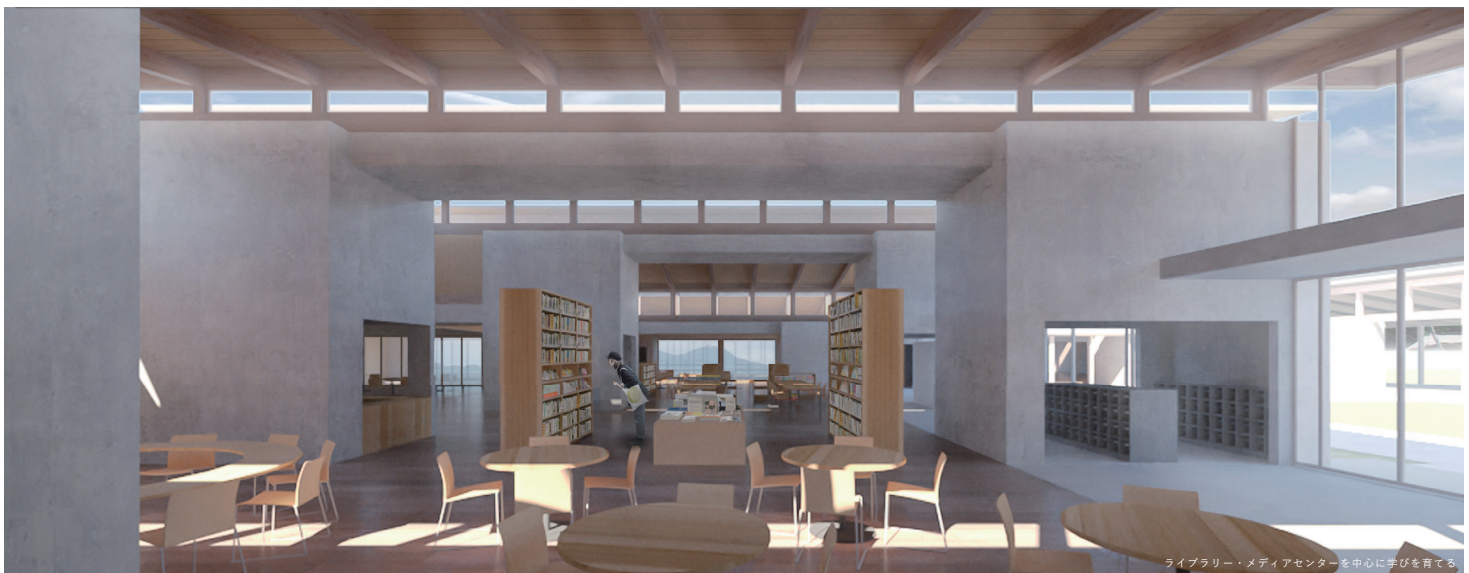
ライブラリー・メディアセンターを中心に学びを育てる