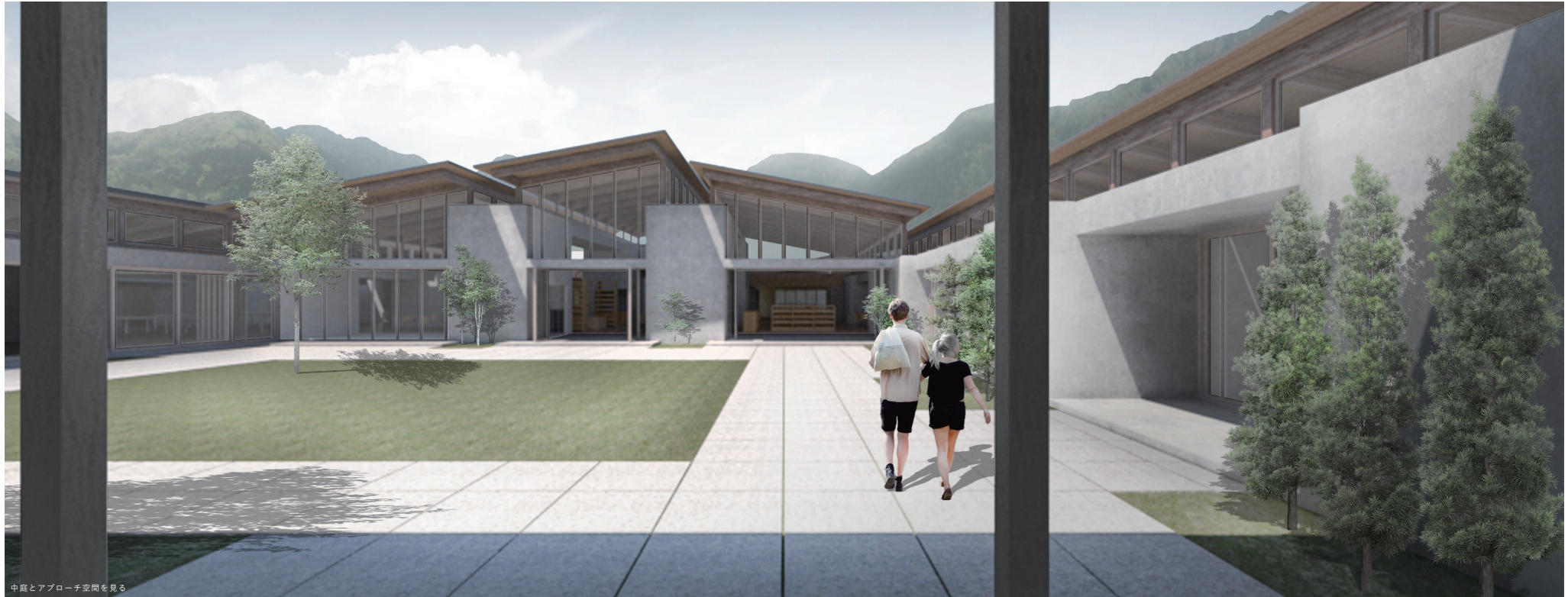
中庭とアプローチ空間を見る